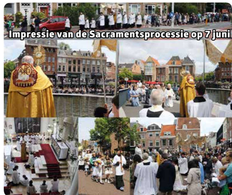
Impressie van de Sacramentsprocessie op 7 juni