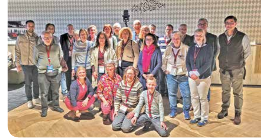
Bijna alle deelnemers vanuit onze parochie bij de Missionaire Conferentie.

kern en hoe we hen het beste kunnen ondersteunen. Voor u als parochiaan betekent dit dat de acties, initiatieven en keuzen in uw kern straks nog duidelijker aansluiten bij onze gezamenlijke missie. We willen dat iedereen zich gezien en welkom voelt, dat activiteiten goed passen bij de kern en dat u merkt hoe onze parochie samen groeit in missionair zijn. Na deze korte herbezinning komen we snel