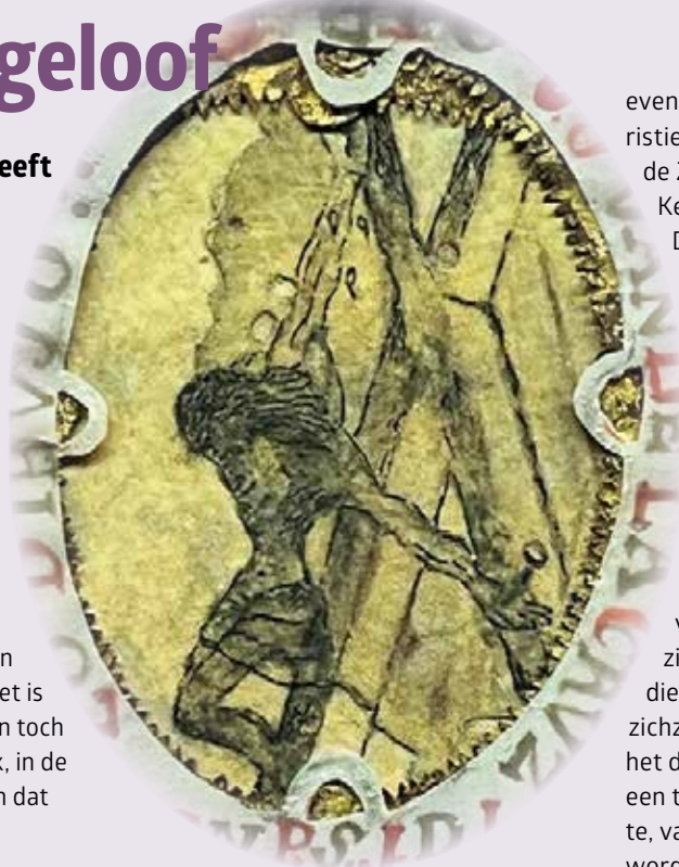
Tekening gemaakt door de h. Johannes van het Kruis (overl. 1591).

Als de liefde in het hart van iemand echt is, dan zal diegene daar altijd woorden aan kunnen geven. Van het eenvoudige "Ik geef om je" tot en met de prachtigste gedichten. Maar woorden zijn niet genoeg. Diegene wil ook laten zien hoe groot de liefde is, in gebaren en geschenken. Maar ook dat is nog niet genoeg. De ware liefde is bereid alles te geven, zichzelf te geven. God heeft alle drie de stappen gezet. Hij heeft tot ons gesproken en in tekenen zijn liefde laten zien. Het Oude en Nieuwe Testament getuigen hiervan. Maar dat was niet genoeg. Hij heeft alles gegeven, Hij heeft zichzelf gegeven,