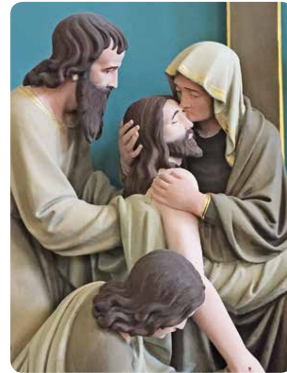
Kruiswegstatie uit de Goede Herderkerk

Wie mij verwondt, die sla ik dood, zelfs wie mij maar een striem toebrengt; Kaïn wordt zevenmaal gewroken, Lamech zevenenzeventigmaal!