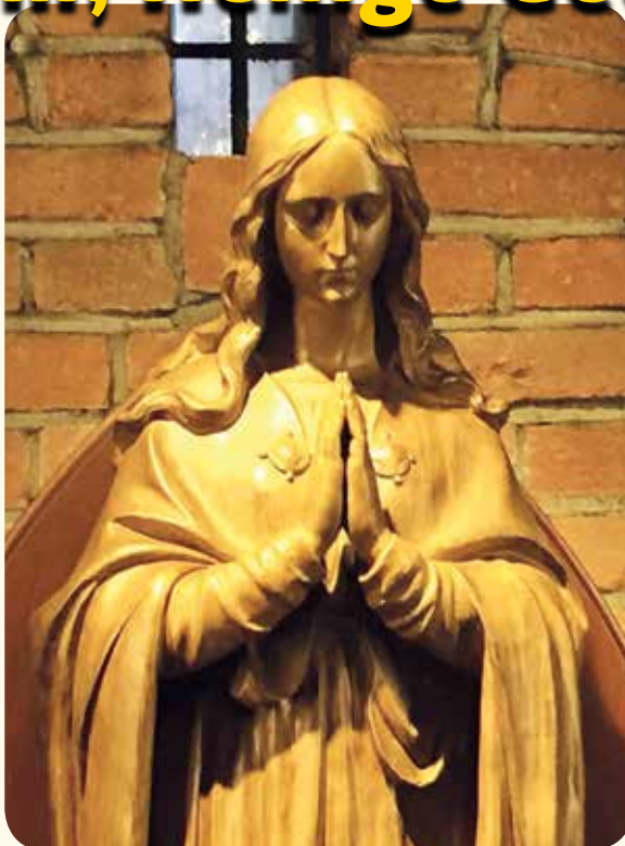
Beeld in de Mariakapel van de bedevaartkerk te Brielle.

Wat de heilige Geest bewerkt is heiligheid, maar misschien houden we dat liever op een